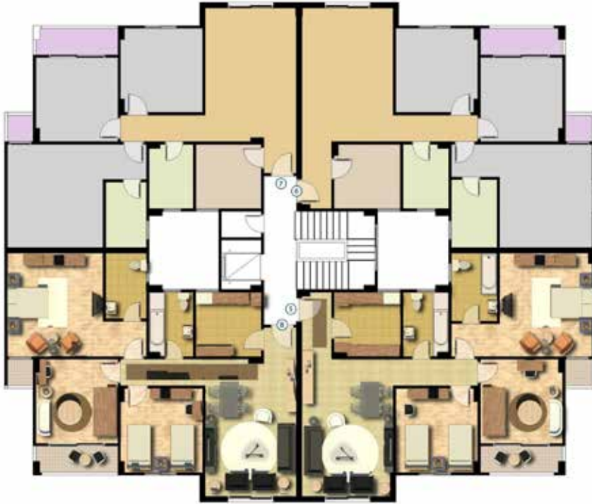
مسقط افقي للدور المتكرر