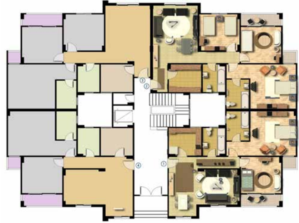
مسقط افقي للدور الارضي