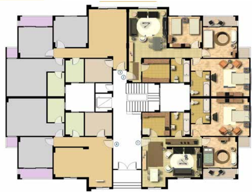
مسطح افقي للدور الارضي