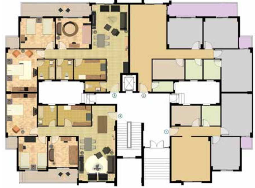
مسقط افقي للدور الارضي