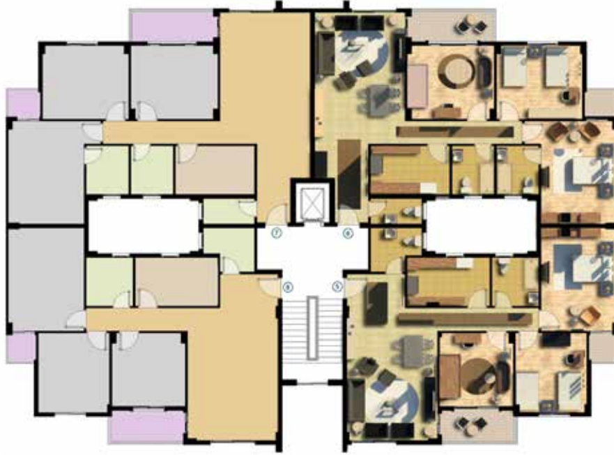
مسقط افقي للدور المتكرر